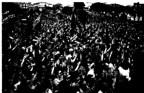
1984, manifestazione Pci

sempre più stanco e flaccido anti-berlusconismo, nella Quercia e poi nel Pd è esercizio sacrosanto ma facile. E tuttavia quel vuoto di identità gravava già sull'ultimo Pci, ed era conseguenza non solo del fallimento del socialismo reale ma anche di quello, a modo suo altrettanto letale, che si era consumato nello specifico della sua vicenda italiana. Era conseguenza non solo degli errori tragici di Stalin e di Breznev, ma anche di quelli di Togliatti e di Berlinguer, il nume tutelare che, come Telese puntualmente descrive, sia il fronte del sì che quello del no cercarono di adoperare come bandiera e profeta, e la cui disastrosa eredità nessuno mise mai, neppure in quel frangente, seriamente in discussione. Invece, forse, per arrivare alla radice del disastro attuale non basta neppure tornare alla Svolta, ma bisogna avere il coraggio di affrontare infine, senza mitologie e per una volta da sinistra, la vicenda del Pci e del suo ultimo vero segretario Enrico Berlinguer.